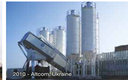
2010 - Altcom, Ukraine