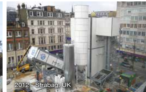
2012 - Strabag, UK