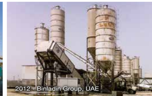
2012 - Binladin Group, UAE