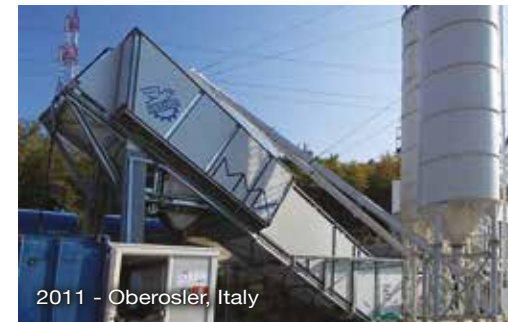
2011 - Oberosler, Italy