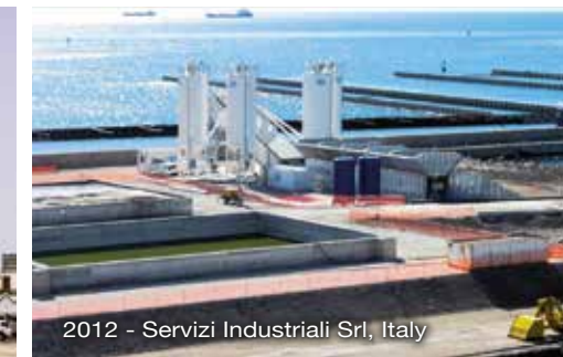
2012 - Servizi Industriali Srl, Italy