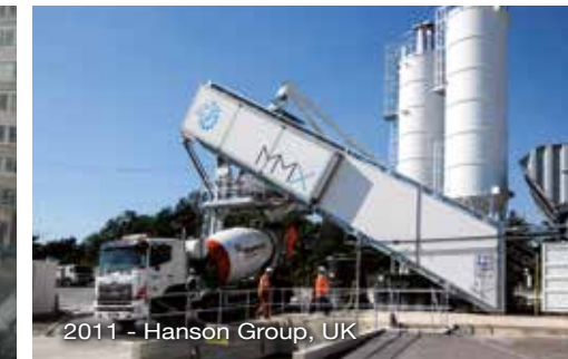
2011 - Hanson Group, UK