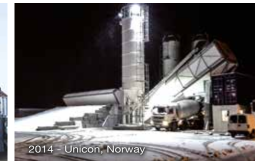
2014 - Unicon, Norway