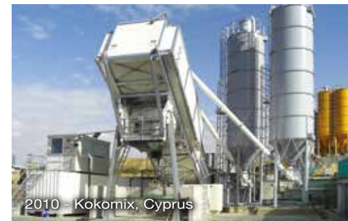
2010 - Kokomix, Cyprus